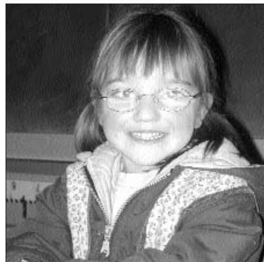
Nesa ha tschintg onns, Dietegen otg. Els abiteschan a Salouf.

E tge è uschiglio anc impurtant ils 24 da december? «Suentmezdi gain nus adina cun il bab per il pignol.» Nua? «En il guaud.» È quai lubi? «Quai fan tuts uschia a Salouf.»